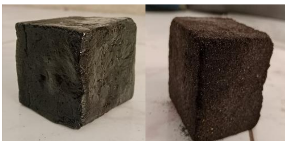
Gambar 1. Sampel beton

Keenam Curing Kering: Setelah didinginkan dengan suhu ruang, selanjutnya sampel dikeluarkan dari cetakan dengan mengetuk sisi samping cetakan pada palu agar memudahkan proses, dan membuka mur juga baut pada cetakan. Setelah sampel terlepas dari cetakan, semua sisi dari sampel dilapisi dengan plastik wrap dan di letakkan pada tempat yang aman dan datar, diamkan selama 28 hari sampai pengujian kuat tekan dilakukan.