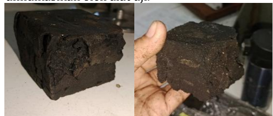
Gambar 2. Sampel setelah pengujian