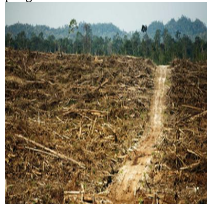
Gambar 1 Lahan hutan gundul

Permasalahannya apakah penyebab dan dampak erosi serta pengelolaan lahan melalui penerapan teknologi konservasi yang dapat diterima petani untuk mencegah dan memperlambat degradasi lahan. Sehingga dengan tujuan untuk mengetahui penyebab terjadi degradasi lahan dan ketahanan pangan