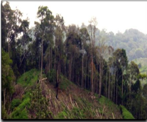
Gambar 3 hutan Indonesia mengalami kritis