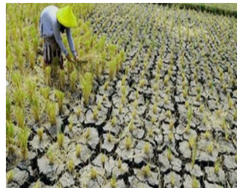
Gambar 2 Degradasi lahan kritis kekeringan